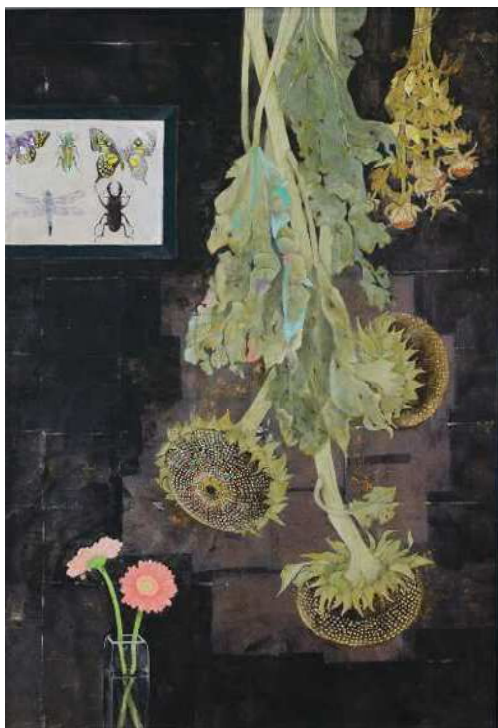
『輪廻』山本 一枝（日本画）