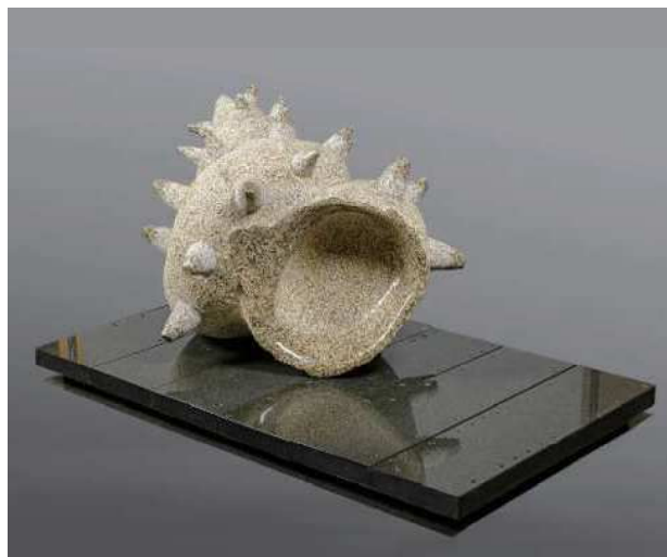
『八月の波の随に』伊藤 弥生（彫刻）