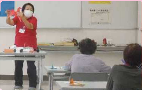
折り紙夢工房「折り紙」(蕨市立北町公民館)