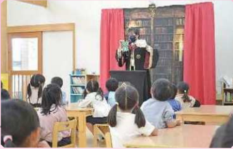
SHUカンパニー「楽しく学んで魔法マジシャンを目指そう! 『魔法学校』」(あゆみ保育園)