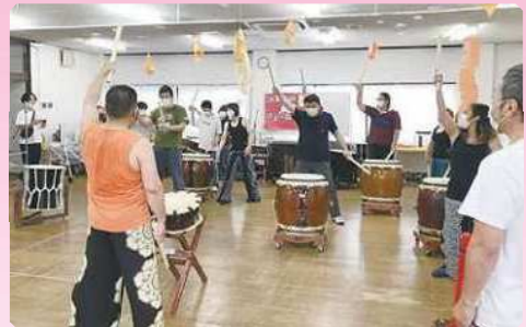
埼玉県太鼓連盟「和太鼓の演奏」(みぬま福祉会)