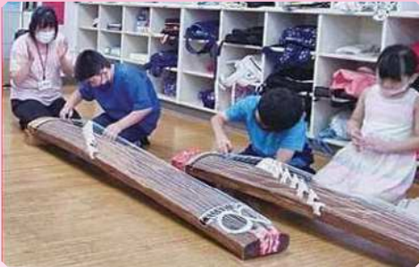
埼玉県三曲協会「三曲(箏、三絃、尺八)のふれあい演奏」(菖蒲学童クラブ)