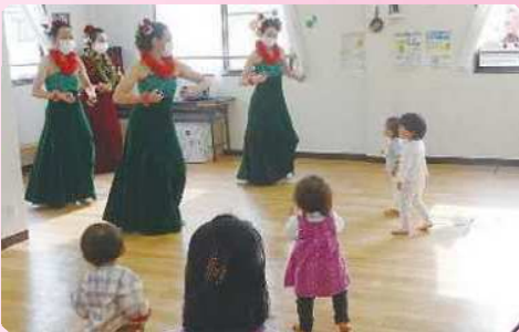
Na Mea Hula 'O Kamaleihulumamo「ハワイアンフラ(フラダンス)」(子育て支援センターきた)