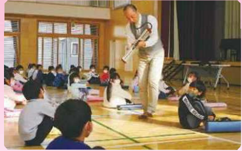
アステリズムミュージック「1年生 はじめての鍵盤ハーモニカ導入講座」(熊谷市立玉井小学校)