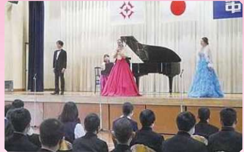
るーぼ「歌・ピアノ・楽器を聴いてみよう!」(行田市立南河原中学校)