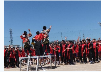
生徒主体で盛り上がる学校行事 全国大会出場のダンス部を筆頭に運動部17、文化部15の部活動が活躍