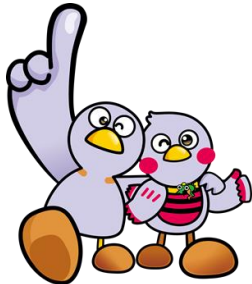
コバトン さいたまっち

さいたまっちは、平成 26 年 11 月 14 日(県民の日)に誕生したマスコット。「くりくりおめめ」と「お腹のボーダー」がトレードマーク。コバトンと一緒に埼玉県を全力でPRしています。