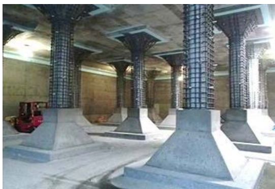
耐震補強工事事例【柱部】