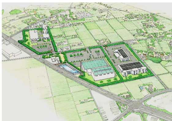
羽生上岩瀬地区完成予想図