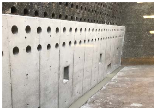
耐震補強工事事例【壁面部】