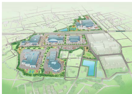
寄居桜沢地区完成予想図