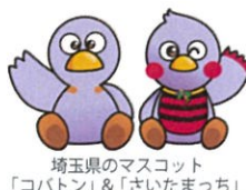
埼玉県のマスコット 「コバタン」&「さいたまっち」

※定員あり/ 要電話予約 ※7か月以上~小学3年生まで ※持ち物 ①おむつ②着替え③おしりふき④ハンドタオル 【午前】10:00~12:00(受付:9:45~) 【午後】13:00~15:00(受付:12:45~) ※いずれか一方の予約制としております。 ※託児場所はソニックシティホール棟地下1階リハーサル室になります。