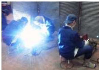
(工業技術科授業風景)

個々の生徒に応じたきめ細やかな指導を行っています。 必要に応じて保護者や外部機関と連携・協力して生徒の教育環境の改善も図ります。 また、生徒の自主的活動として部活動や生徒会活動も活発に行われています。毎日授業前に生徒・教員と一緒に食べる給食は、とても好評でおいしいです。 HPは毎日更新していますのでご覧ください。