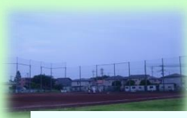
第2グラウンド(野球)