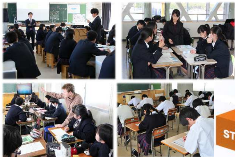
1年英語の学力別少人数授業 全員で英検に挑戦(1年)