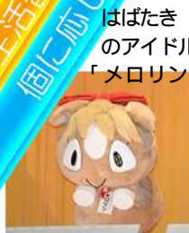
はばたきのアイドル「メロリン」

高等部は農作業・メンテナンス・陶芸・木工・手工芸・革工芸の6班。中学部は農作業・陶芸・木工・紙リサイクルの4班で活動。