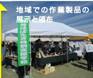
地域での作業製品の展示と頒布