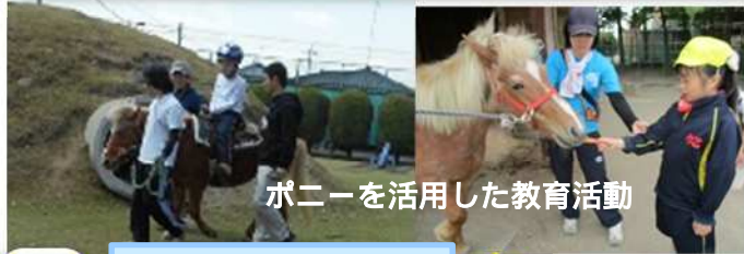
ポニーを活用した教育活動