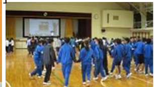
地域の小・中学校との交流会