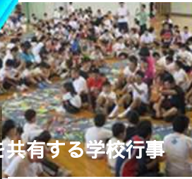
感動を共有する学校行事