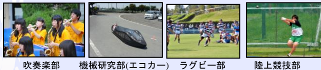
吹奏楽部 機械研究部(エコカー) ラグビー部 陸上競技部