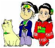
マツカ・松太郎・松姫