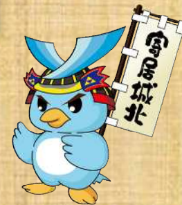
本校キャラクター城太郎