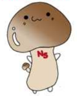
滑川総合高等学校 マスコットキャラクター 「nameco」