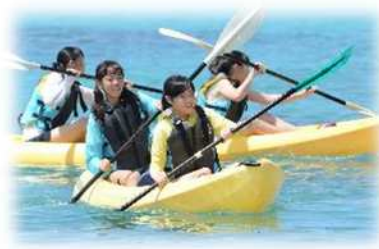
沖縄修学旅行(11月) マリン体験