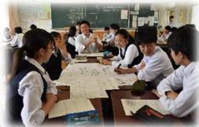
総合的な探究の時間 グループワークで防災について学習