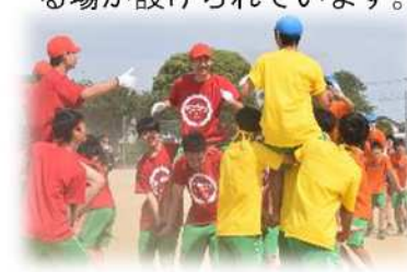
体育祭 各団3年生を中心に競い合います