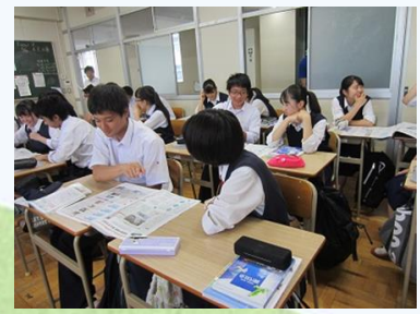
対話を取り入れた授業 & ICTを活用した授業 タブレットは120台