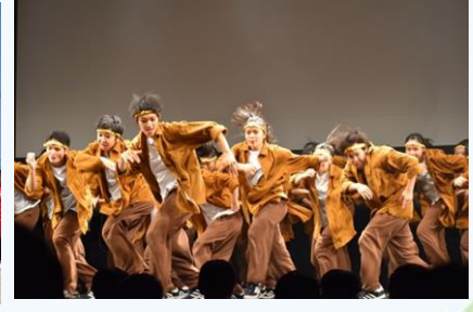
全国大会出場のダンス部を筆頭に運動部19、文化部15の部活動が活躍