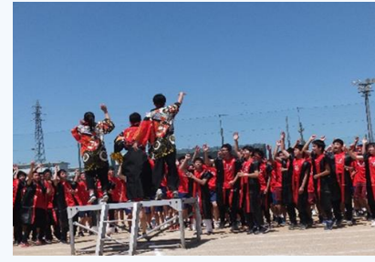
生徒主体で盛り上がる学校行事