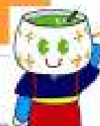
マスコットキャラクター たまちゃん