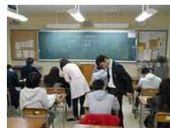
ソーシャル スキルトレーニング

・ 学習サポートによる支援 ・ スクールカウンセラー、 スクールソーシャルワーカー による相談体制 ・ 自立支援事業による面談、 講演、企業体験等