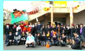
本校キャラクター みのりちゃん