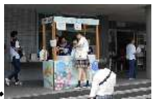
文化祭 クッキー 販売

球技大会、遠足（各年）、 修学旅行、文化祭（全日制 と合同）、芸術鑑賞教室、 交通安全教室、保健講話、 非行防止教室、大掃除等