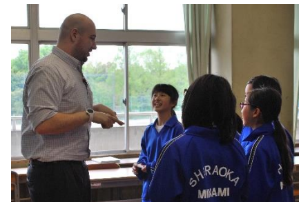
〈ALTと会話を楽しむ生徒たち〉