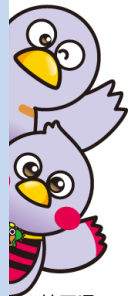
埼玉県のマスコット 「コバトン」 「さいたまっち」

1月22日(月)、23日(火)、24日(水)、25日(木) 29日(月)、30日(火)、2月1日(木) 各回2回(①10:00~12:00、②14:00~16:00) 各回定員16人(計224人)