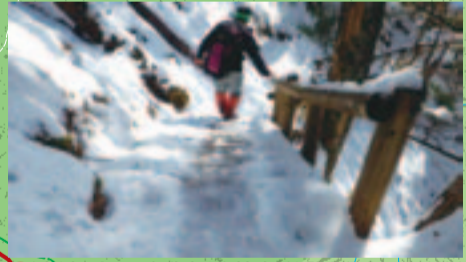
3 凍結による転倒・滑落多発箇所