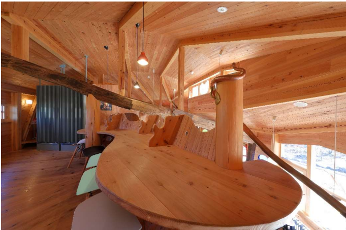
2階カフェスペース