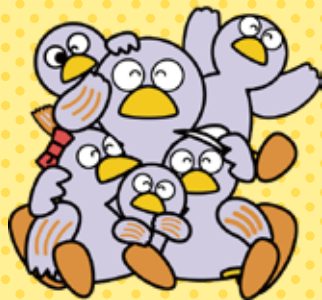
埼玉県のマスコット 「コバトン」