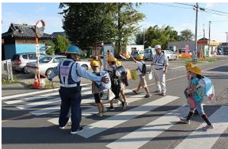
朝・夕の見守り活動