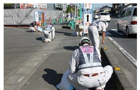
現場周辺の清掃活動