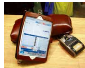
集配には小型のiPad miniを使用。集配先からもデータはすぐに連動される。

このシステムの導入で、事務作業にかかる時間は大幅短縮。ホームページでの24時間の集配受付も開始し、分析を基にSNSやチラシによる宣伝に取り組んだ結果、2015年は前年比150%、16年はさらに120%の売上を達成している。