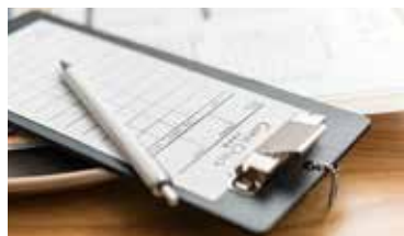
手作業による集計・管理は、人手と時間が必要。

※…「攻めのIT経営」とは収益拡大や事業革新等のために積極的なICT投資を行う経営のこと。