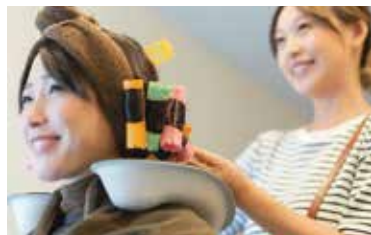
スタッフ情報もお客様が美容室を選ぶ基準のひとつ。