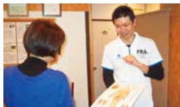
不調を改善するだけでなく、心身共に健康になれるサロンづくりに取り組んだ。

しかし、新店舗は自分一人でのスタート。受付業務や施術を行う傍ら、ホームページの開設と運営を行わなければならなかった。