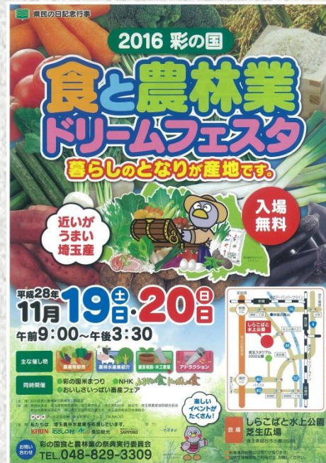
今年度のポスター