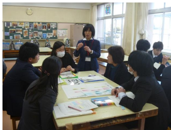
授業者を交えての協議