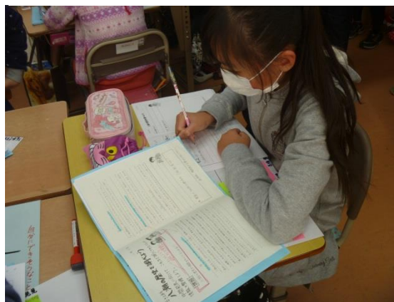
前時の学習と比較しながら本時を振り返る