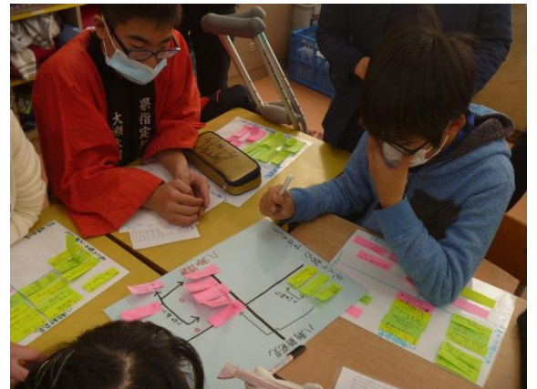
前時までに個人でまとめた「八潮の歴史」への思い（座標軸）