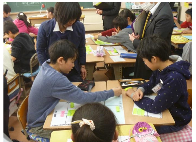
児童の活動の見取りと適切な言葉がけ