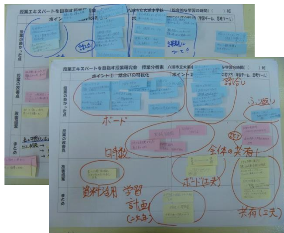
意見を分類し見やすく整理した授業分析表