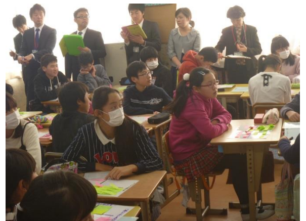
他のグループの発表を真剣に聞く児童