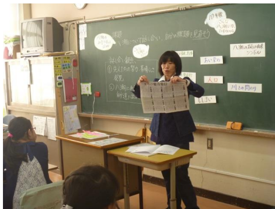
新たな課題につなげる情報提供 (新聞に掲載された八潮市長の言葉)

○自分も単元計画での悩みを持っていました。グループで話し合っていた時にアイデアが出たのですぐに実践したいです。ありがとうございました。