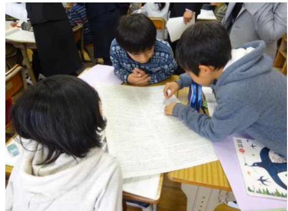
丸ごと読みを意識した話し合い