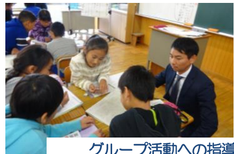
グループ活動への指導・支援