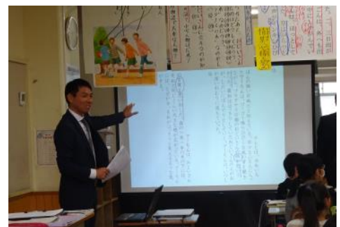
2つの場面の情景描写の比較