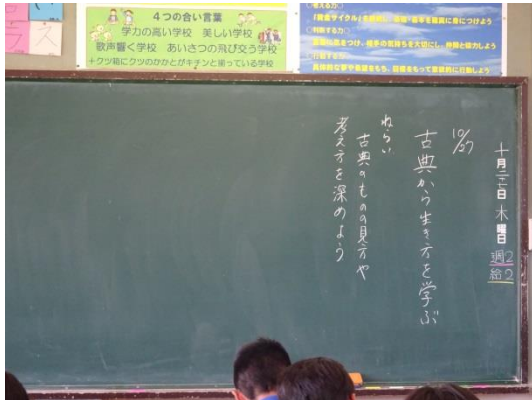
本時のねらいを板書し、学習の見通しをもつ

単元名 古典から生き方を学ぶ 第2学年 教材名 「枕草子」「平家物語」「仁和寺にある法師」