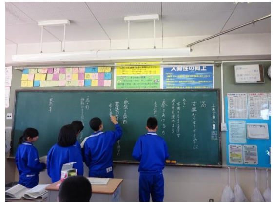
クラス全体での交流

○協議をとおして、他の先生のやり方や考え方を学ぶことができました。自分の授業についても、このように振り返る必要があると深く感じました。