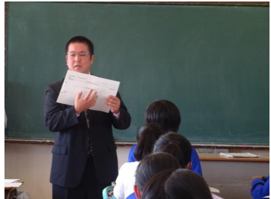
思考ツール（読解マップ）の説明