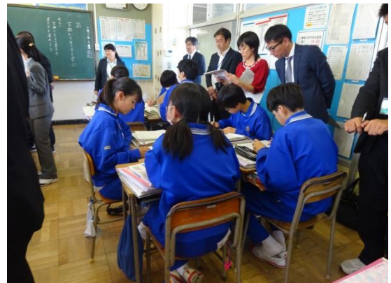
グループによる読解マップの交流