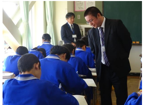
机間指導による個別の支援