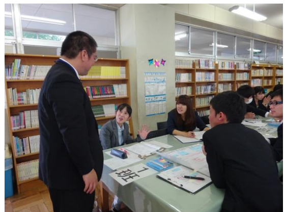
ワークショップ型の研究協議