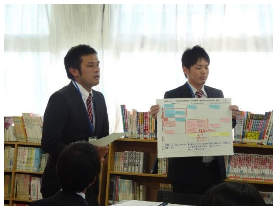
グループごとの発表