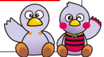
埼玉県マスコット 「コバトン」「さいたまっち」 Las Mascotas de Saitama, Kobaton y Saitamatch