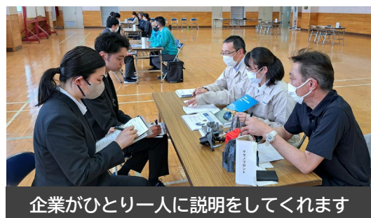
企業がひとり一人に説明をしてくれます