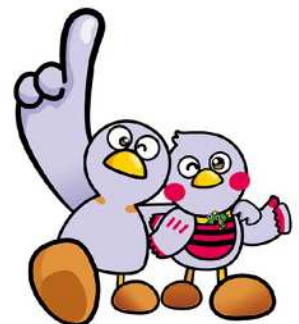
埼玉県マスコット 「コバトン」 「さいたまっち」