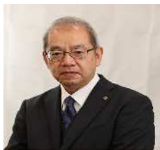
埼玉県教育委員会教育長