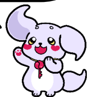
埼玉県労働委員会 マスコット「たまろー」