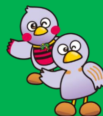
埼玉県マスコット 「さいたまっち&コバトン」