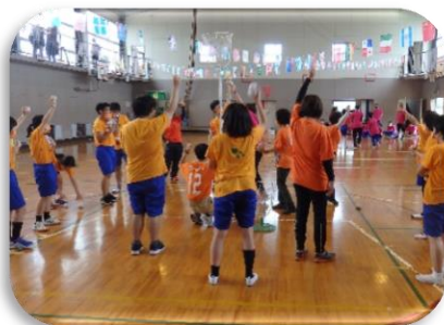
体育的行事（体育参観日）