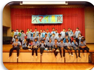
文化的行事（げんき祭り）