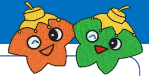
ゆっぴー はっぴー