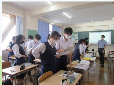
対話を取り入れた授業&ICTを活用した授業 タブレットは120台