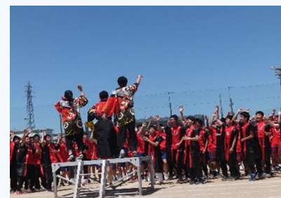
生徒主体で盛り上がる学校行事