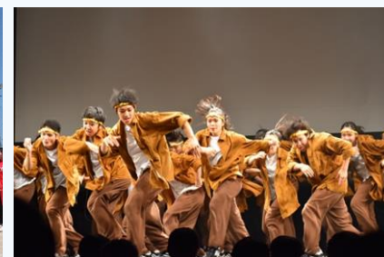
全国大会出場のダンス部を筆頭に運動部17、文化部13の部活動が活躍