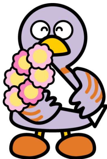
埼玉県マスコット「コバトン」