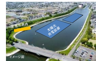
太陽光発電設備設置予定地(権堂調節池・久喜市)

県管理調節池を活用した太陽光発電設備の設置を市町村に促すため、基盤整備により再生可能エネルギーの地産地消や地域防災によるレジリエントなまちづくりの推進を支援する。