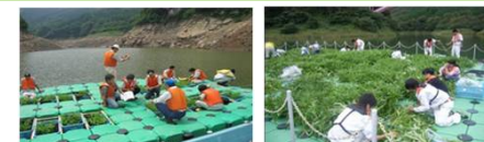
浮く畑の設置事例(阿木川ダム・岐阜県)

大相模調節池に「浮く畑」を設置し、民間事業者や周辺の高校等と連携して、空心菜等の水耕栽培を行い、水質改善を促進する。