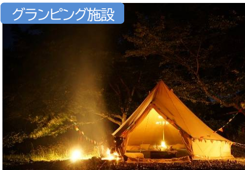
都幾川(ときがわ町)