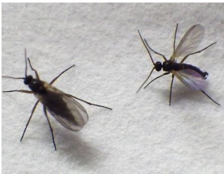
写真1 成虫 (左: 雌 右: 雄)