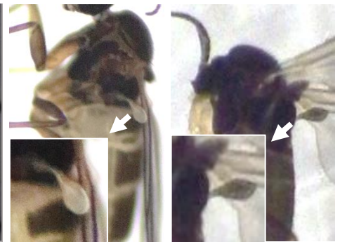
写真3 成虫の平均棍

ネギネクロバネキノコバエ (左) は半透明 チバクロバネキノコバエ (右) は黒色