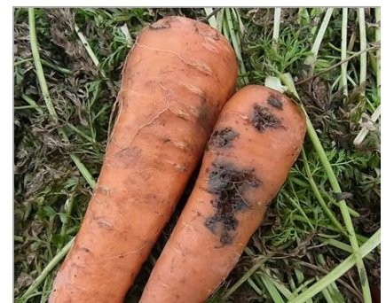
写真6 ニンジンの食害