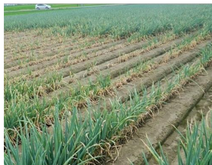
写真5 激しい食害を受けたネギほ場