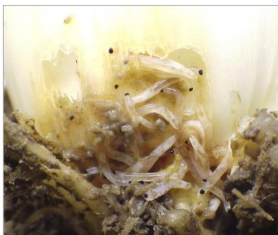
写真4 ネギの盤茎を食害する幼虫

ニンジンでは食害部分は小さいですが、その周辺が黒褐色に変色するため、わずかな食害でも商品価値を失い出荷不能となります。そのため、幼虫の寄生数が少なくても被害が大きくなります。