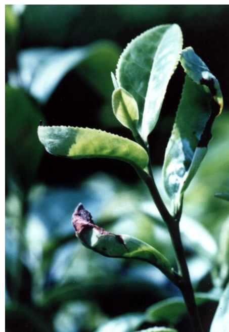
写真3 チャノミドリヒメヨコバイによる葉の被害