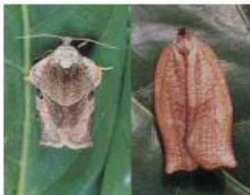
写真1 雄成虫(左)と雌成虫