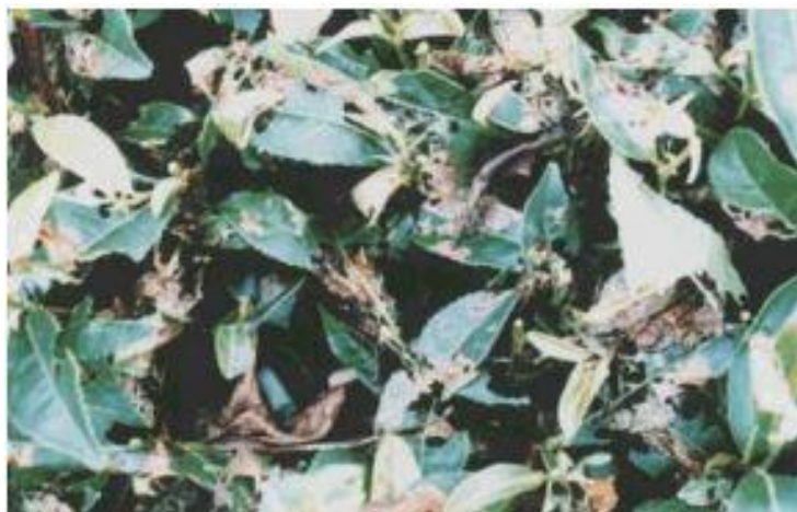
写真5 多発生時の被害状況