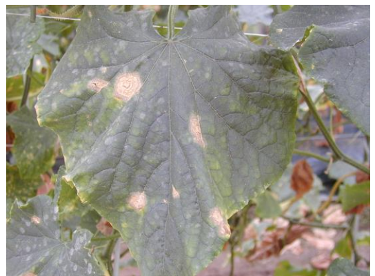
写真2 葉に発生した大型病斑