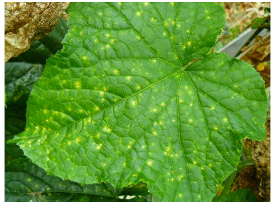
写真1 葉に発生した小型病斑