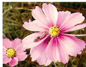
写真6 コスモスを食害する幼虫