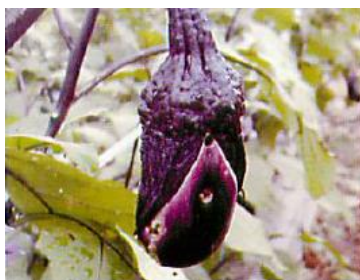
写真4 幼虫の食害により穴の空いたナス