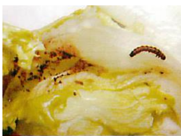
写真5 レタスの結球内部を食害する幼虫