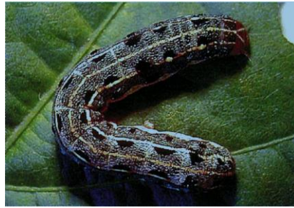
写真2 老齢幼虫 (体長4cm)