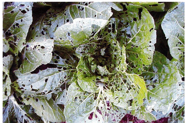
写真4 老齢幼虫による食害