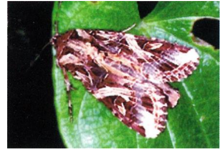
写真3 成虫 (体長2cm) 斜めの白帯模様が特徴