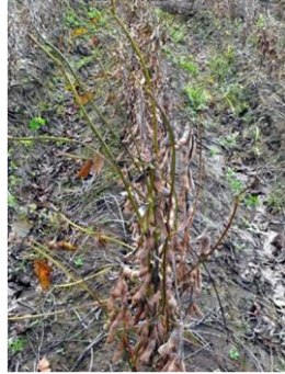
写真 7 被害株