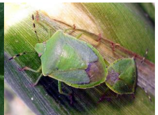
写真2 アオクサカメムシ(左から幼虫・黒色型、同・緑色型、成虫)