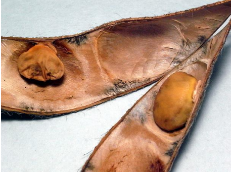
写真 6 子実肥大期の食害

莢伸長期や子実肥大期に吸汁されると、子実が肥大しないために莢が板状の「板莢」になります(写真 6)。また、子実への養分転流が抑制されるため葉の黄変が遅く、成熟期を過ぎても葉柄が付いています(写真 7)。肥大期以降の口針挿入では、その部位が食痕として変色します(写真 8)。