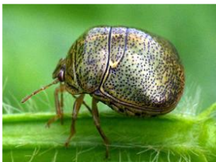
写真1 マルカメムシ成虫

成虫の体長は16mm内外で、暗褐色の体色に小さな斑紋が存在します。多種の果実を吸汁します。