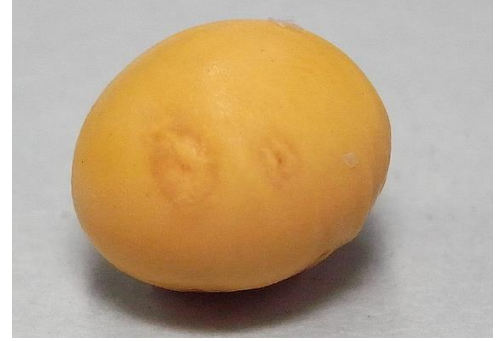
写真 8 子実肥大期以降の食害痕