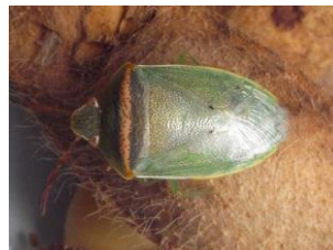
写真4 イチモンジカメムシ成虫