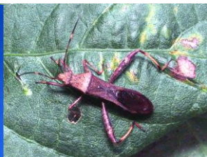
写真3 ホソヘリカメムシ(左:幼虫、右:成虫)