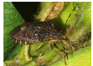
写真5 クサギカメムシ成虫