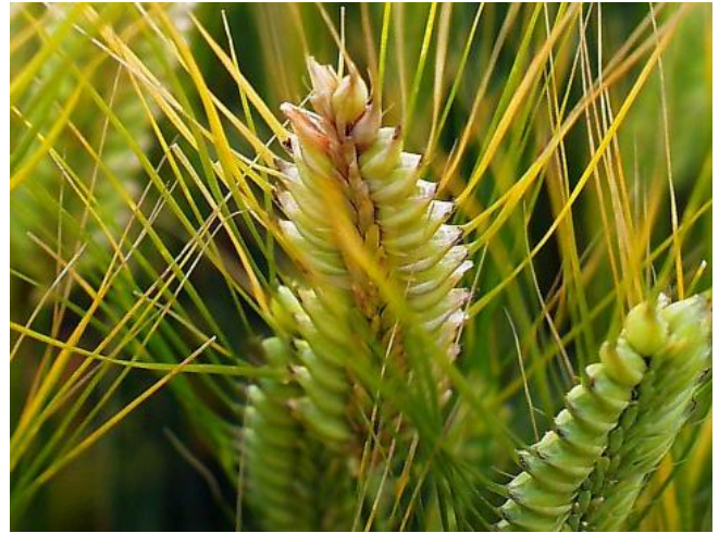
写真2 オオムギの被害穂