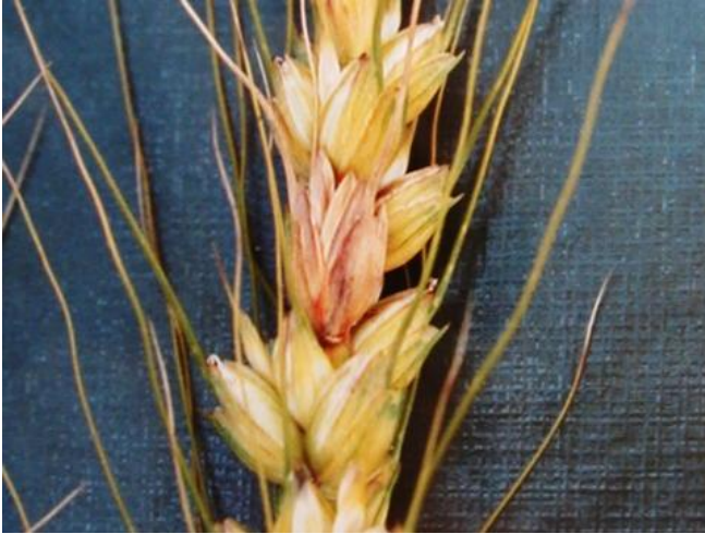
写真1 コムギの被害穂

なお、罹病子実を多く含んだものを食用や飼料に用いると、人や家畜に中毒症状を起こすことがあります。このため、食品衛生法でかび毒の基準が定められており、赤かび粒が混入すれば出荷できません。