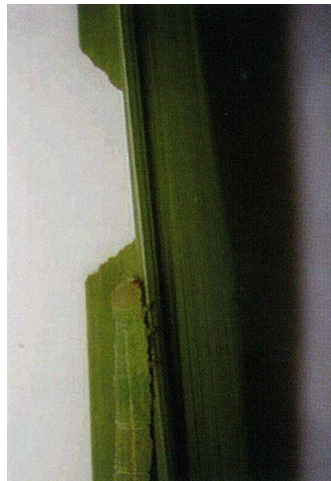
写真 5 階段状の食害痕