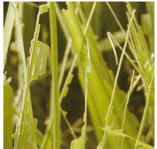
写真 6 多発生条件で食い尽くされた葉