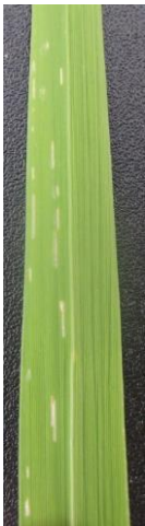
写真 4 かすり状の食害痕