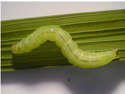
写真 1 老齢幼虫