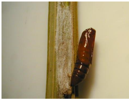
写真 2 蛹