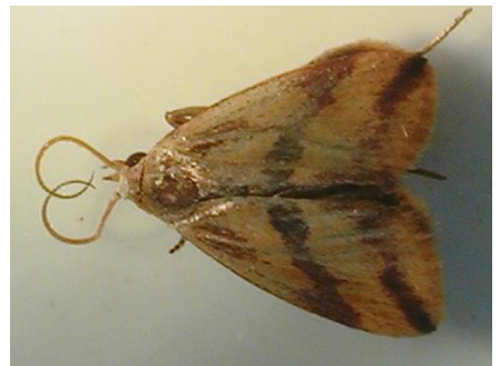
写真 3 成虫