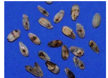
写真5 クモヘリカメムシによる斑点米 多発時には不稔粒が増加する