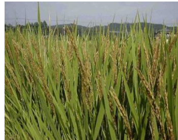
写真4 クモヘリカメムシ多発圃場 不稔となり傾穂しない