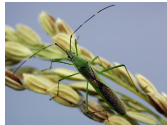
写真2 クモヘリカメムシ成虫 緑色で細長く、翅鞘は黄褐色で光沢がある