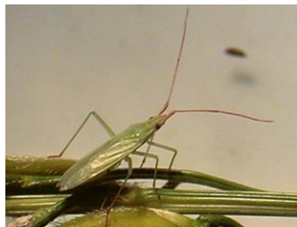
写真1 アカヒゲホソミドリカスミカメ成虫 細長く緑色、ヒゲ(触角)が長く赤い

成虫は体長15～17mm、幅2mm。カメムシ特有の臭いがします。成虫で越冬し、春の活動開始後は、イネ科植物などで増殖します。幼虫は8月頃から年1回発生します。