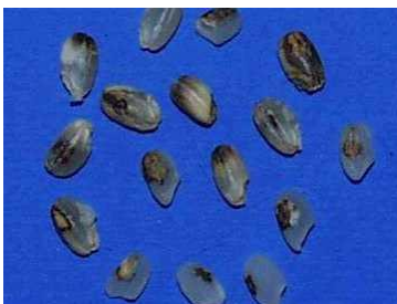
写真3 アカヒゲホソミドリカスミカメによる斑点米 玄米の頂部に斑点が多い

穂を加害し、斑点米を発生させるため玄米の品質が低下します。被害がひどい場合には、不稔やくず米となり減収を招きます。アカヒゲホソミドリカスミカメなど小型の種は、乳熟期に成虫による加害が集中し、クモヘリカメムシなど大型の種では、黄熟期まで成虫及び幼虫が長く加害すると考えられます。玄米にできる斑点の現れ方は、カメムシの種類や加害時のイネの登熟段階で変化しますが、斑点の中心部にカメムシが刺したあとの小褐点が認められます。