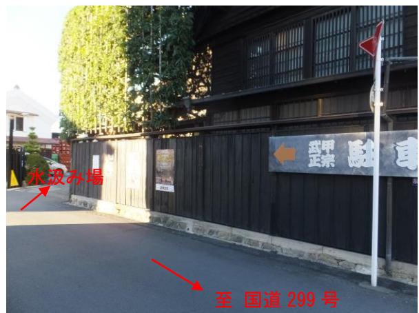
武甲酒造の脇の道を進む。