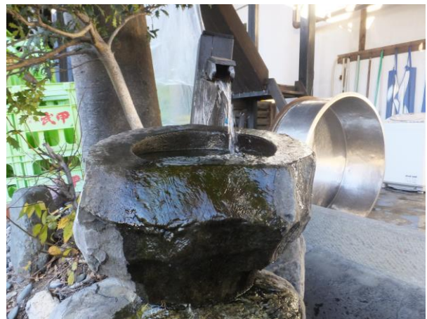
武甲酒造の水汲み場全景