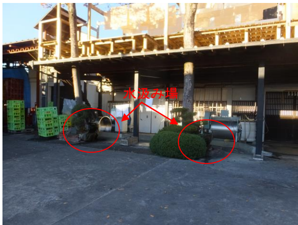
武甲酒造の地下水は2か所から汲むことができる