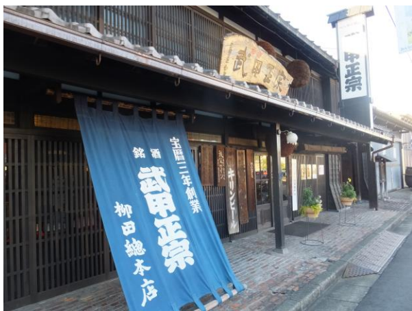
武甲酒造の店構え