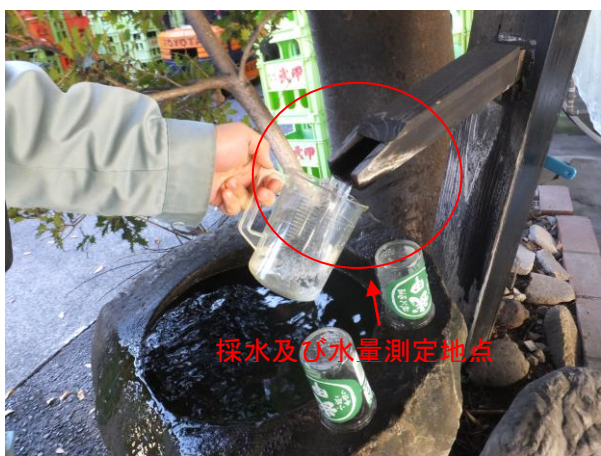
本調査では、向かって左手側にある水汲み場から採水及び水量の測定を行った。